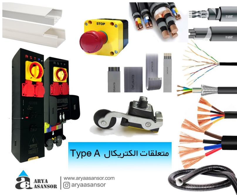
متعلقات الکتریکیال Type A

متعلقات الکتریکیال در نظر گرفته شده در آسانسور ساختمان شما شامل بهترین قطعات می باشد از جمله شالتر NF-سیم های افشان کاوه تک یا زر سیم- سیم شیلد جهت ارتباط موتور - کابل 6 زوج کرمان جهت نمراتورها-کابل 1*4 کاوه تک -داکت 9 و 3 الوند البرز- لوله خرطومی روکش فلزی رهودر - تراول کابل دت وایر ساخت چک- کلید فارچی FTC - تابلو سه فاز شرکت ایران طرح جدید